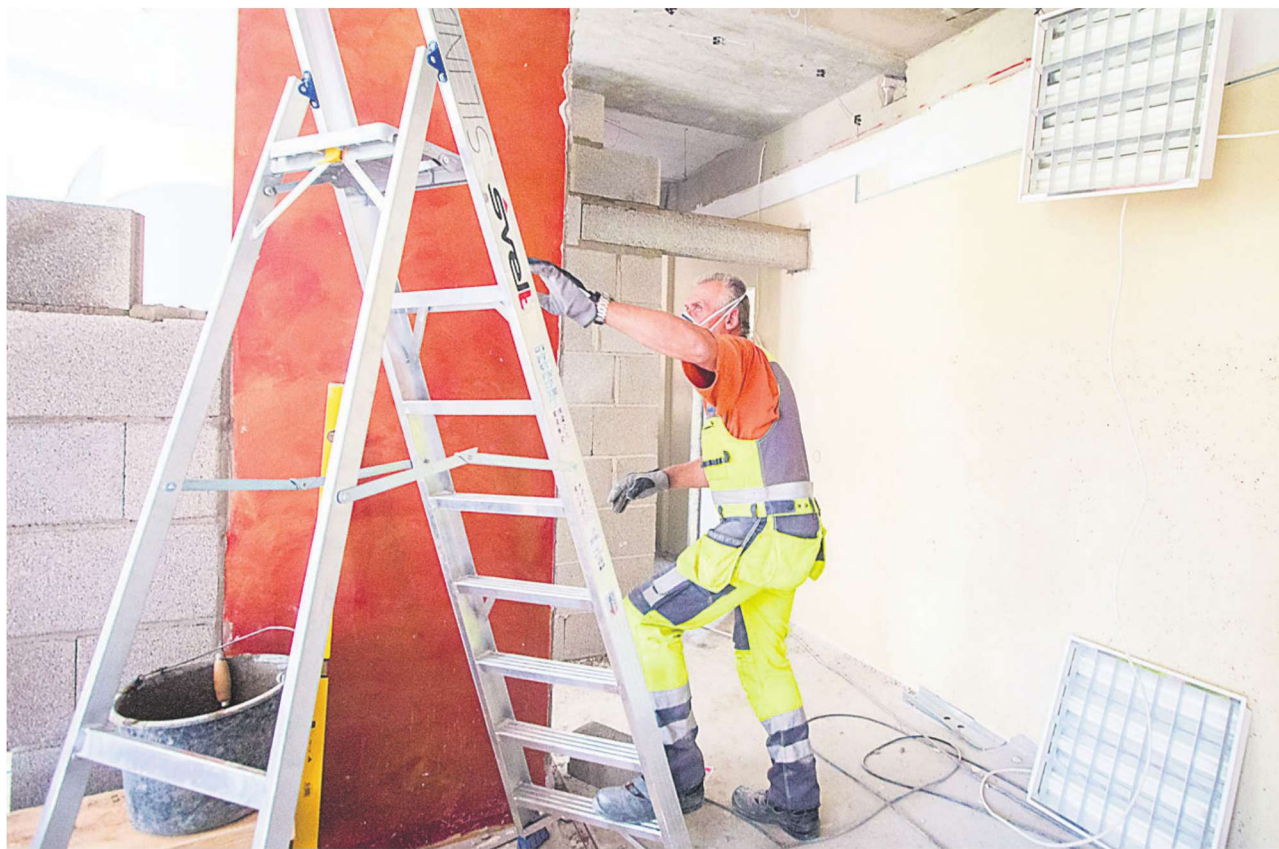
Uulu külas suletud postkontori arvelt saab lasteaed söimerühma ruumid, ümberehitamine on alanud.

Siseseinte lammutamine ja uute ehitamine toimub üheaegselt, sest söimerühma ruumide üleandmise tähtaeg on lähedal. Pikemalt läheb ventilatsiooni paigaldamisega, kuid lasteaia