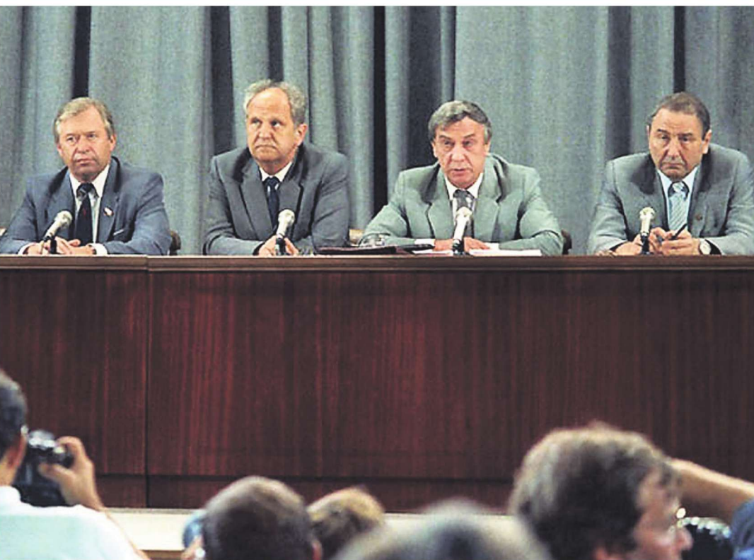
■ Pressikonverentsil on putšistidest kaadrisse jäänud kaheksast osalisest neli. Vasakult teine on NSV Liidu siseminister Boriss Pugo, kelle enesetapp oli karmim karistus, mis neile osaks sai.